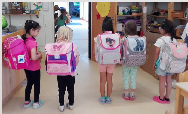
KiTa-Kinder präsentieren ihre neuen Schulranzen

Mittlerweile im 5. Jahr verwendete die Bü.NE in Zusammenarbeit mit der Deutschen Bank Spenden, um den Kindern besonders finanzschwacher Familien den Schulstart ein wenig zu erleichtern. Die Mittel stammen aus Sammlungen der Bank, deren Team, der SAP-Stiftung der Bank, der Jungen Bü.NE, der Bü.NE und Privatpersonen. 46 Schulranzen samt hilfreicher Utensilien konnten in 5 Kitas und dem städtischen Integrationsamt übergeben werden. Für die Überbringer war es jedes Mal ein emotionales Erlebnis, die Freude und die strahlenden Augen der Kinder bei der Übergabe zu sehen.